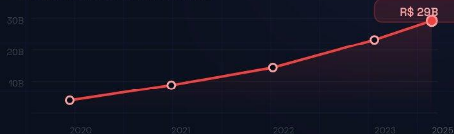
Perdas com fraudes financeiras

O custo vai além do financeiro. Cada fraude não detectada compromete o capital regulatório, eleva o custo de captação e corrói a confiança do mercado.